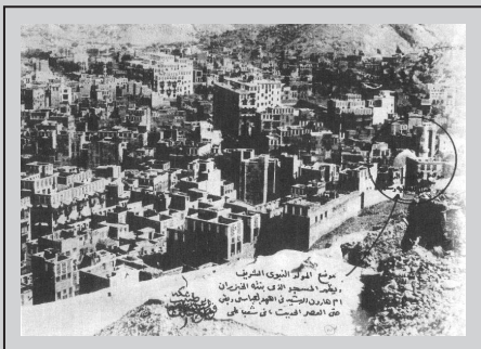
Најстариата фототографија на местото каде е роден Мухамед Алејхиселам.

Според преданијата, пред раѓањето на Божјиот пратеник Мухамед имало предзнаци за неговото доаѓање. Рушењето на четиринаесетте кули од Ксерскиот дворец во Персија, гаснењето на оганот кој долговековно бил предмет на обожување и слично.