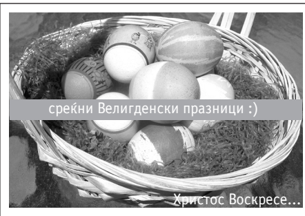
среќни Велигденски празници :)

Во пресрет сме на уште еден Велигден. Минуваме низ уште еден пост, низ уште една подготовка достојно да му се поклониме на Господ Исус Христос. Повторно оваа година сите камбани ќе звонат, најавувајќи го постојаното раѓање на новиот живот - на вечниот живот. Повторно сите ќе го опејуваме и славиме дарителот на нашата слобода. Повторно ќе Му пееме на Оној на Кого од минатото од почетокот достојно му се поклонуваме и ќе Му се поклонуваме сè до крајот за кој само Тој знае кога ќе биде, а дотогаш нам ни останува само да „го чекаме воскресението на мртвите и животот во идниот век“. Амин!