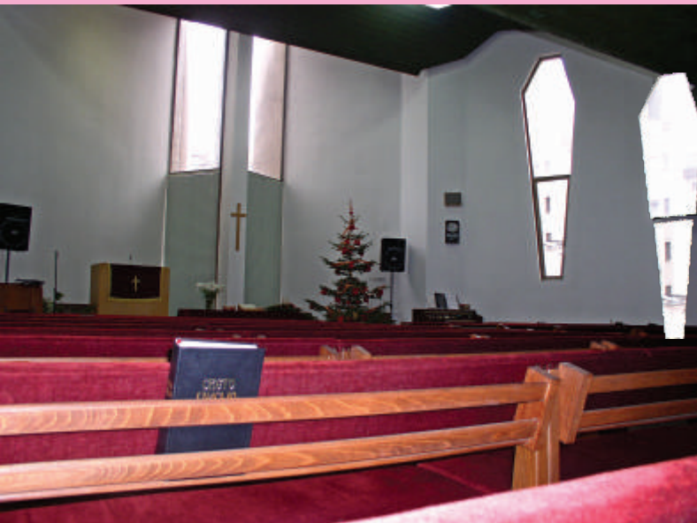
Внатрешност од Евангелско-методистичката црква - Скопје