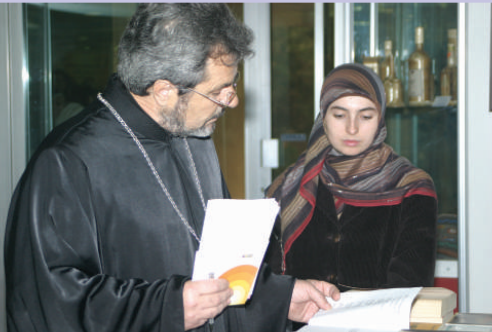
Од Деновите на верските заедници во Македонија