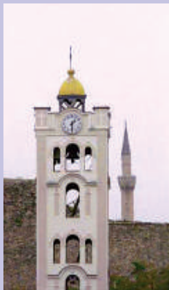
Црквата Св. Димитрија и Мустафа Пашината џамија во Скопје во еден кадар

Ти, кој живееш под покрив на Севишниот, што се одмараш во сенката на Седржителот, речи Му на Господа: Прибежиште мое! Тврдино моја! Боже мој, на Кого се надевам!