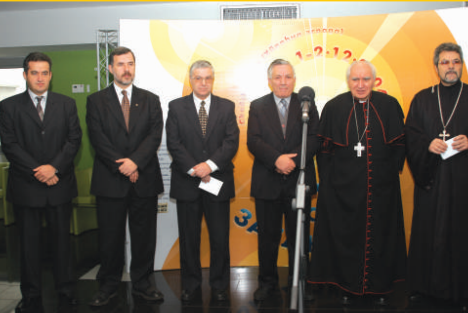
Од Отварањето на Деновите на верските заедници во Македонија, декември 2004 година претставник на МЦМС со претставници на пет верски заедници.