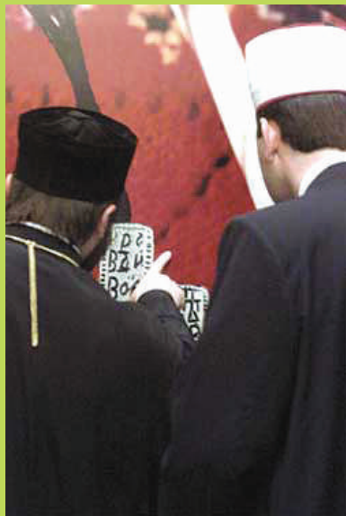
Свештени лица од православна и исламска вероисповед.