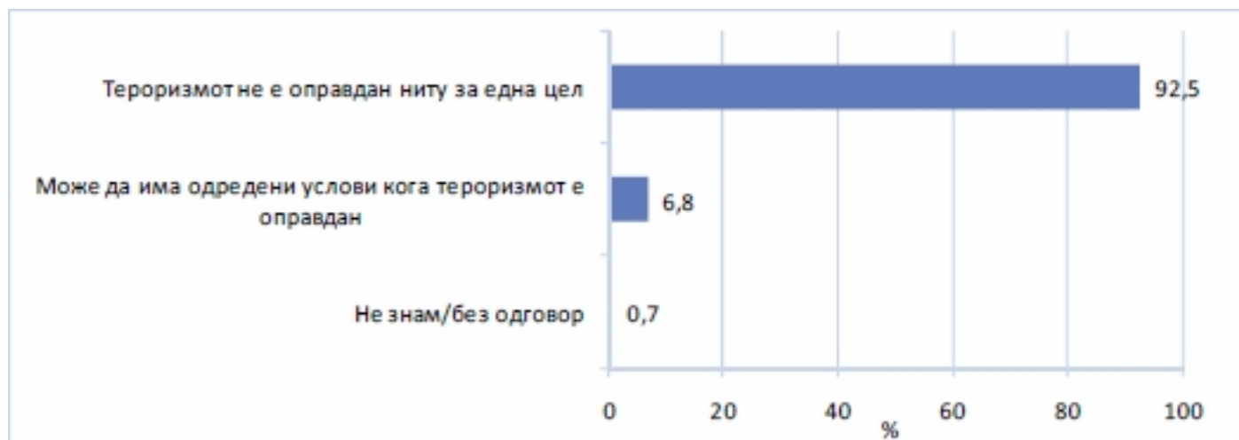
Графикон 1. Ставови на граѓаните за оправданост на тероризмот

Големо мнозинство граѓани (92,5 %) не го оправдуваат тероризмот за ниту една цел. Не постојат разлики по социо-демографска основа.